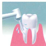
ブラシノズルの場合